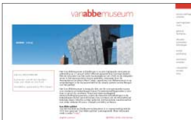
Van Abbemuseum: vormgeving zit boodschap en gebruik van website niet in de weg