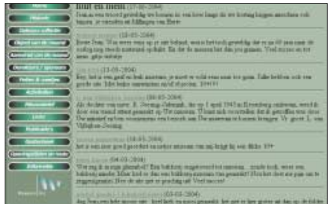
Achterhoeks Museum 1940-1945: een uitgebreid gastenboek met veel hartverwarmende boodschappen

In totaal hebben twaalf musea een nieuwsbrief op de website. 14 Hiervan bieden zeven de mogelijkheid om je via e-mail of een webformulier hierop te abonneren. Teylers Museum laat je als potentiële nieuwsbrieflezers lelijk zoeken, aangezien de nieuwsbrief zelf niet op de website staat,