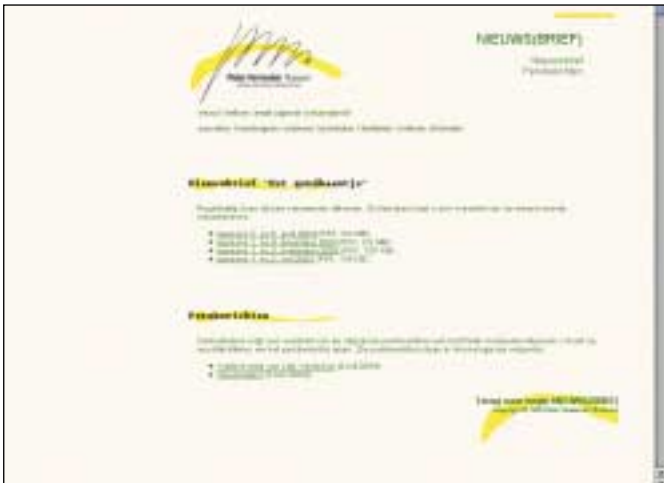
Pieter Vermeulen Museum: bezoeker moet over breedband beschikken om de meest recente brief – 3,9 MB groot – te kunnen lezen

We hebben een testvraag opgenomen naar online hulppagina's, maar alle musea scoorden negatief op deze vorm van gebruikersondersteuning. 12 Als het de werking van de site betreft, gaat men er blindelings van uit dat alles voor zich spreekt. En dat is niet altijd terecht. Enkele websites zijn zo vormgegeven dat de doorsnee gebruiker wel enige behoefte aan uitleg heeft. Er zitten sites bij (zoals die van het Kröller-Müller Museum ) die dermate 'eigenwijs' zijn, dat aanwijzingen ook voor ervaren surfers nuttig zouden zijn. Kortom, dit aspect doet af aan de informatieverlening.