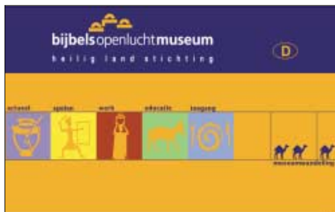
Bijbels Openluchtmuseum: mooie pictogrammen