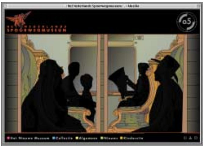
Nederlands Spoorwegmuseum: mooie animaties