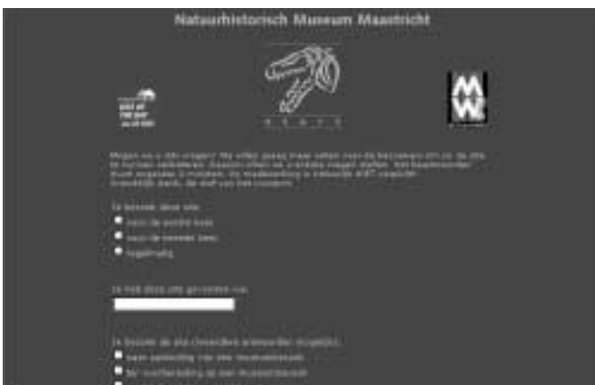
Natuurhistorisch Museum Maastricht: gebruikersenquête op de 'splash screen'

Ook in deze test hebben we de vraag naar webtoegankelijkheid voor visueel of anderszins gehandicapten opgenomen. 7 En helaas hebben we ook nu weer moeten constateren dat het hiermee onder de door ons geteste sites slecht gesteld is. Bij de controle van de sites met behulp van Bobby 8 blijkt dat vijf sites een 'ja, mits' hebben op level 1. Het is dan nog de vraag of de site ook echt toegankelijk is. Zo kreeg Museum Boijmans van Beuningen